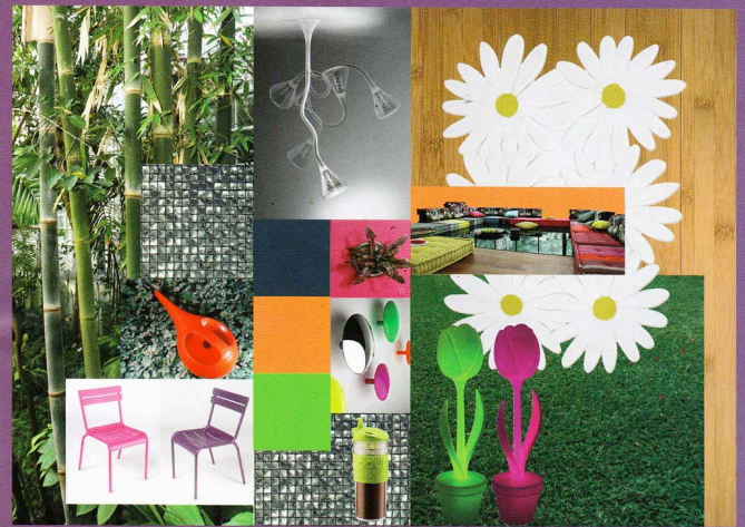
Tapis marguerite (design José Garcia) en 2,10 m x 3 m. Arrosoir Kiwi (design Danilo d'Urbano et Paolo Lönsszi), marqueté Alessi. Meubles métalliques de couleur Farnob, Lampadaire Tulip de Mondosign, chez Mycolor. Patères de couleur Sentou, Travel mag Bodum